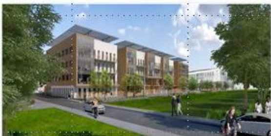
Aspect extérieur du bâtiment